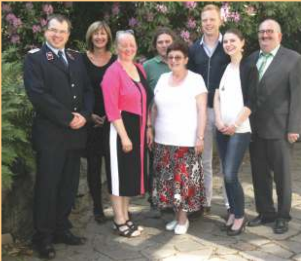
Das Organisatorenteam und die Spendenempfänger