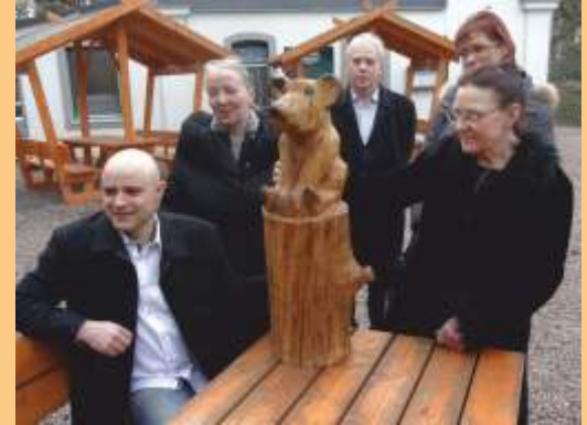
Übergabe von Kunibärt